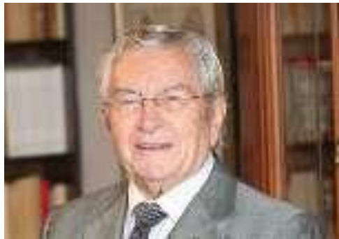
Fundraising y mecenazgo en la Universidad de Vigo

Parecen dos palabras intercambiables o que la una implica la otra. La primera indica captación de fondos, la segunda se refiere al que realiza la donación de fondos con un objetivo determinado, siempre de manera altruista. Esta tiene un viejo origen, ya en los tiempos del Imperio Romano, cuando Caio Mecenaz, muy próximo al emperador Octavio Augusto, protegió con esplendor y abundancia de medios a poetas, artistas , literatos, siendo amigo y patrocinador de Virgilio, Horacio, Propertio y otros cultos y sobresalientes romanos.